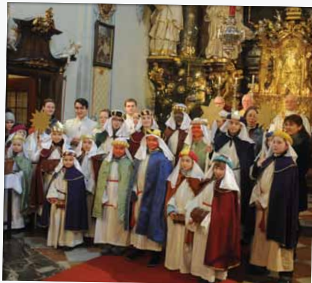
Den feierlichen Abschluss der Dreikönigsaktion bildete heuer die Sternsingermesse mit Weihbischof Franz Lackner . Die Freude der Kinder und Jugendlichen übertrug sich auf die versammelte Pfarrgemeinde.